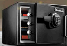
Caja Fuerte Digital SFW082ET SKU: 93477