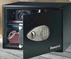
Caja fuerte Sentury X125 SKU: 57557