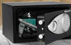
Caja fuerte electrónica X041E SKU: 71523