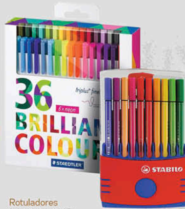
Rotuladores SKU. 90440, 80052.