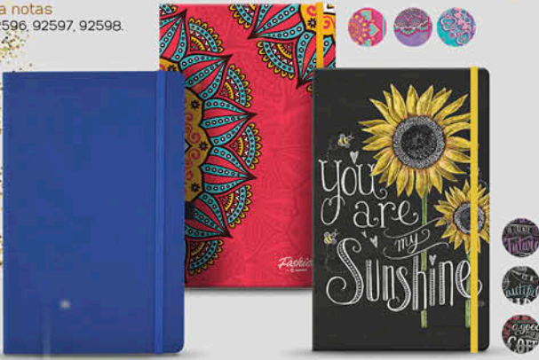
Libreta notas SKU. 92596, 92597, 92598.