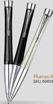
Plumas finas SKU. 69614, 69615, 69620.