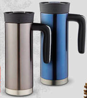
Vaso Termo Contigo SKU. 94495, 95817.